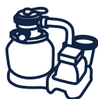
Filtration à sable Norme NF P 90-318